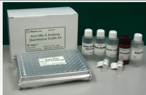
本写真と実際の製品は仕様変更により異なる場合があります