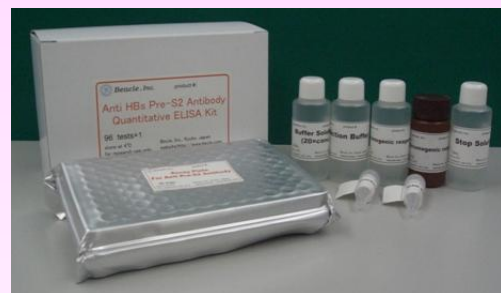
本写真と実際の製品は仕様変更により異なる場合があります

【キット構成】 測定に必要な試薬が全て揃っております (詳細は裏面をご覧ください。)