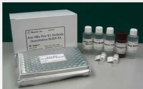
本写真と実際の製品は仕様変更により異なる場合があります

【キット構成】 測定に必要な試薬が全て揃っております (詳細は裏面をご覧ください。)