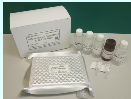
本写真と実際の製品は仕様変更により異なる場合があります

【キット構成】 測定に必要な試薬が全て揃っております(詳細は裏面をご覧ください。)