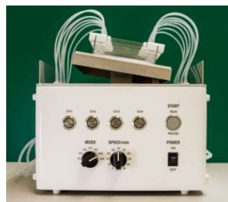
Auto Western Multi