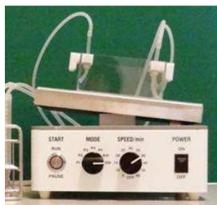
Auto Western Mini