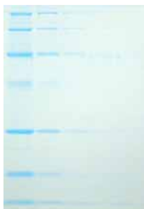
CBB Rapid Stain