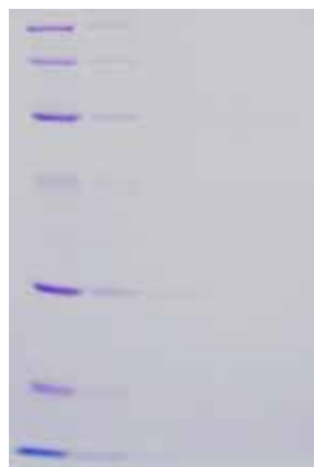
一般的な染色法 (CBB R-250)