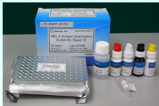
本写真と実際の製品は仕様変更により異なる場合があります

【キット構成】 測定に必要な試薬が全て揃っております (詳細は裏面をご覧ください。)